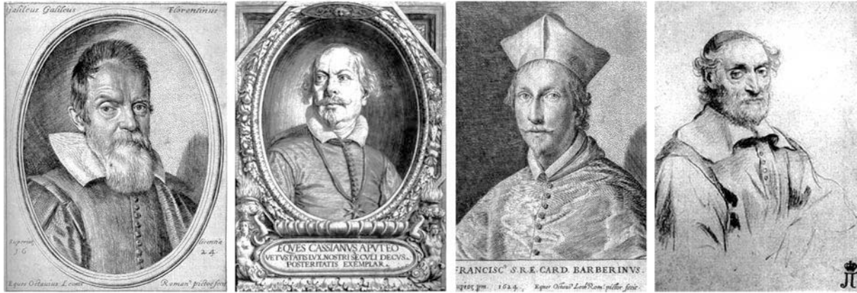
Fig. 2. Quelques membres illustres de l'Accademia dei Lincei (de gauche à droite) : Galileo Galilei (1564-1642) ; Cassiano dal Pozzo (1588-1657) ; le cardinal Francesco Barberini (1597-1679), neveu du pape Urbain VIII ; Nicolas-Claude Fabri de Peiresc (1588-1657).