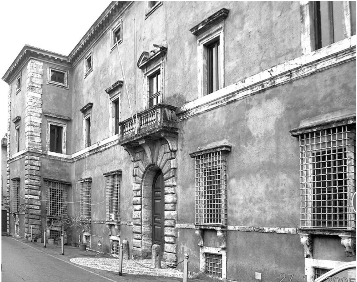
Fig. 1. Le palais Cesi à Acquasparta, premier siège de l'Accademia dei Lincei.