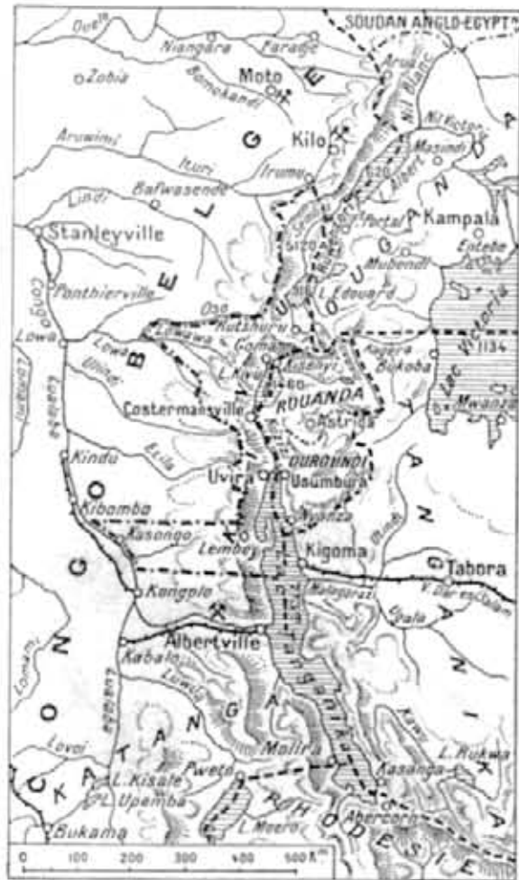
Le territoire du Kivu.

Le Kivu (1), c'est, au faite de l'Afrique, l'une des dernières zones de l'exploration africaine sur les confins orientaux du Congo belge, en bordure du Rouanda-Ououndi, que le traité de Versailles a placé sous le mandat belge, et de l'Ouganda sous protectorat anglais. Mais en même temps, généralement salubre grâce à son altitude, intéressante par les produits de son sol et par ses ressources minérales, cette région est de celles dont la mise