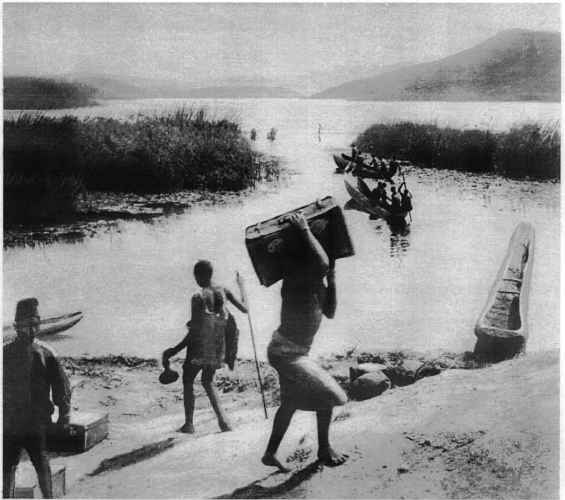
Traversée en pirogues du lac Bunyoni.