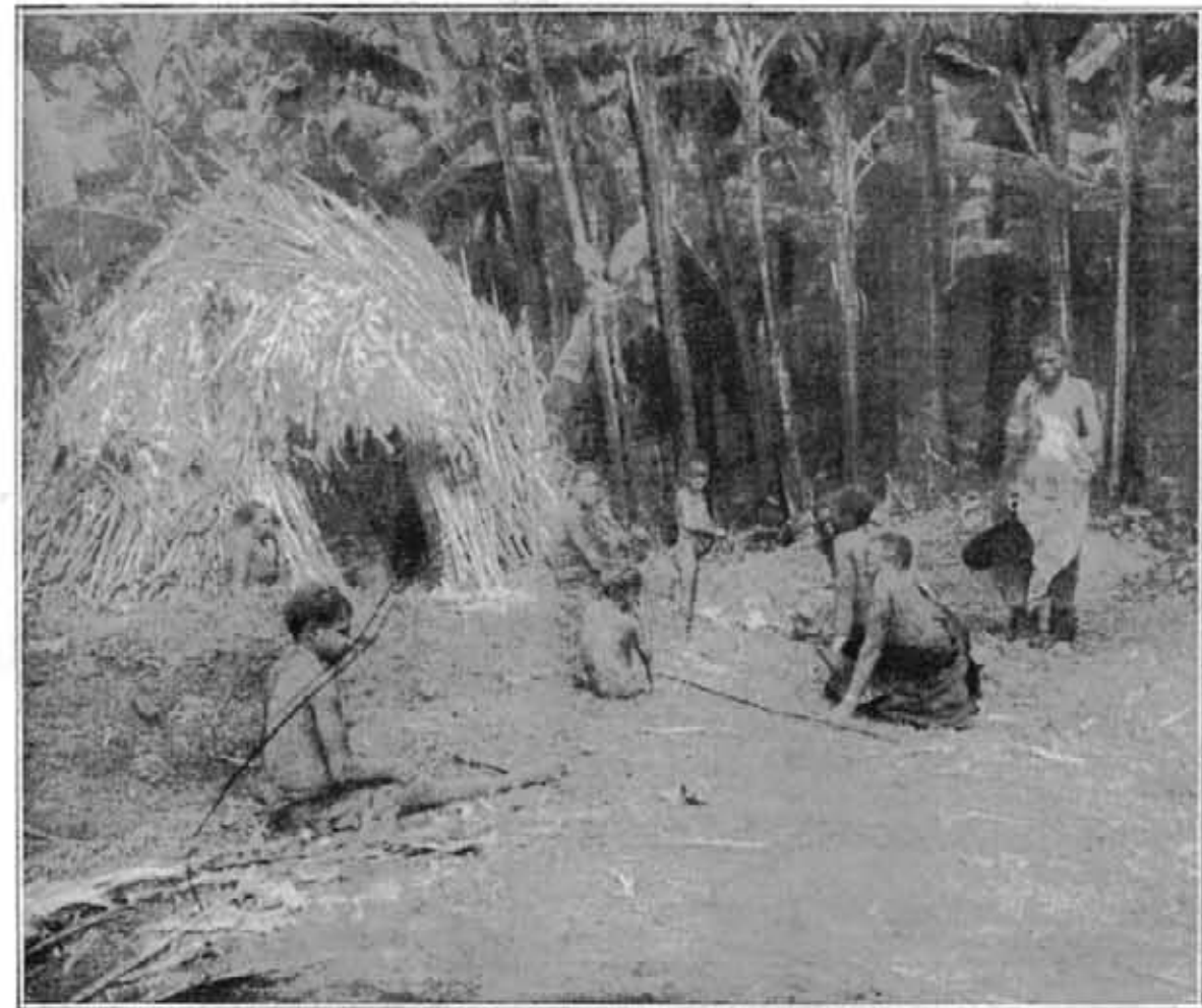
Famille indigène dans la bananerie, entre Kisenyi et Kibati.

Il est vraiment admirable de voir quelle connaissance relativement précise les anciens avaient