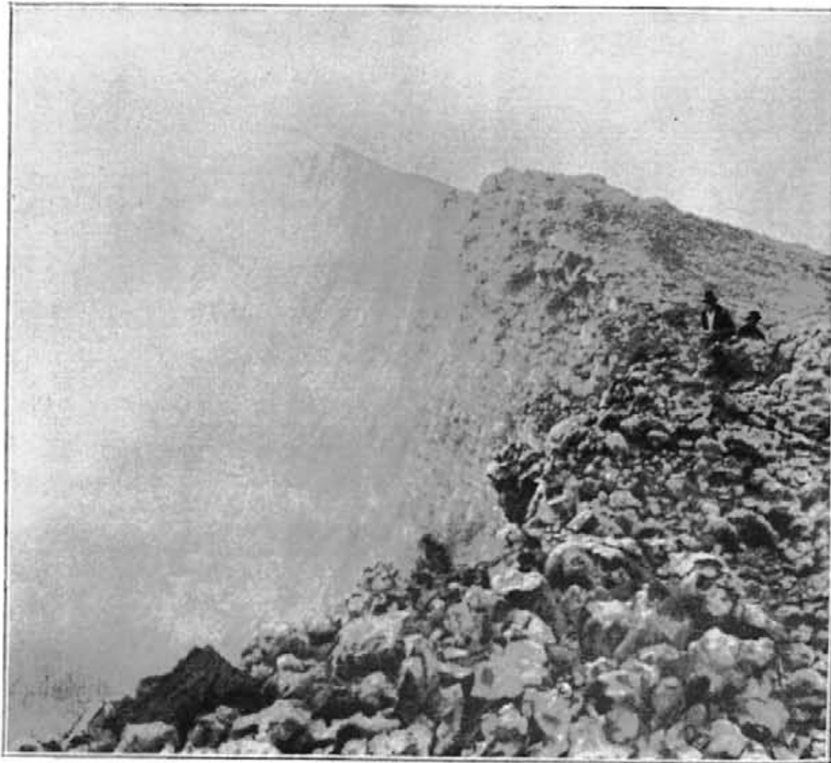
Le cratère du Tchaniiragongo, noyé dans d'abondantes fumeroles.

* ... La mystérieuse montagne qui donnait la mort à quiconque oserait se risquer à la gravir... mais des hommes blancs en ont éteint le feu. » — (Von Götzen).