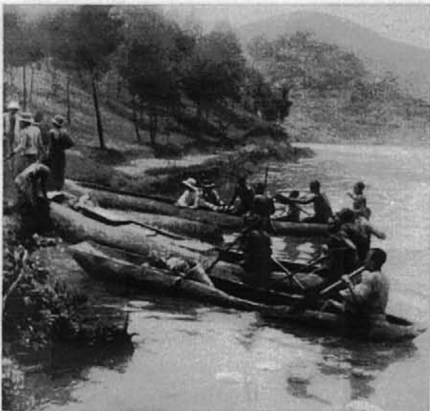
Embarquement sur le lac Bunyoni.