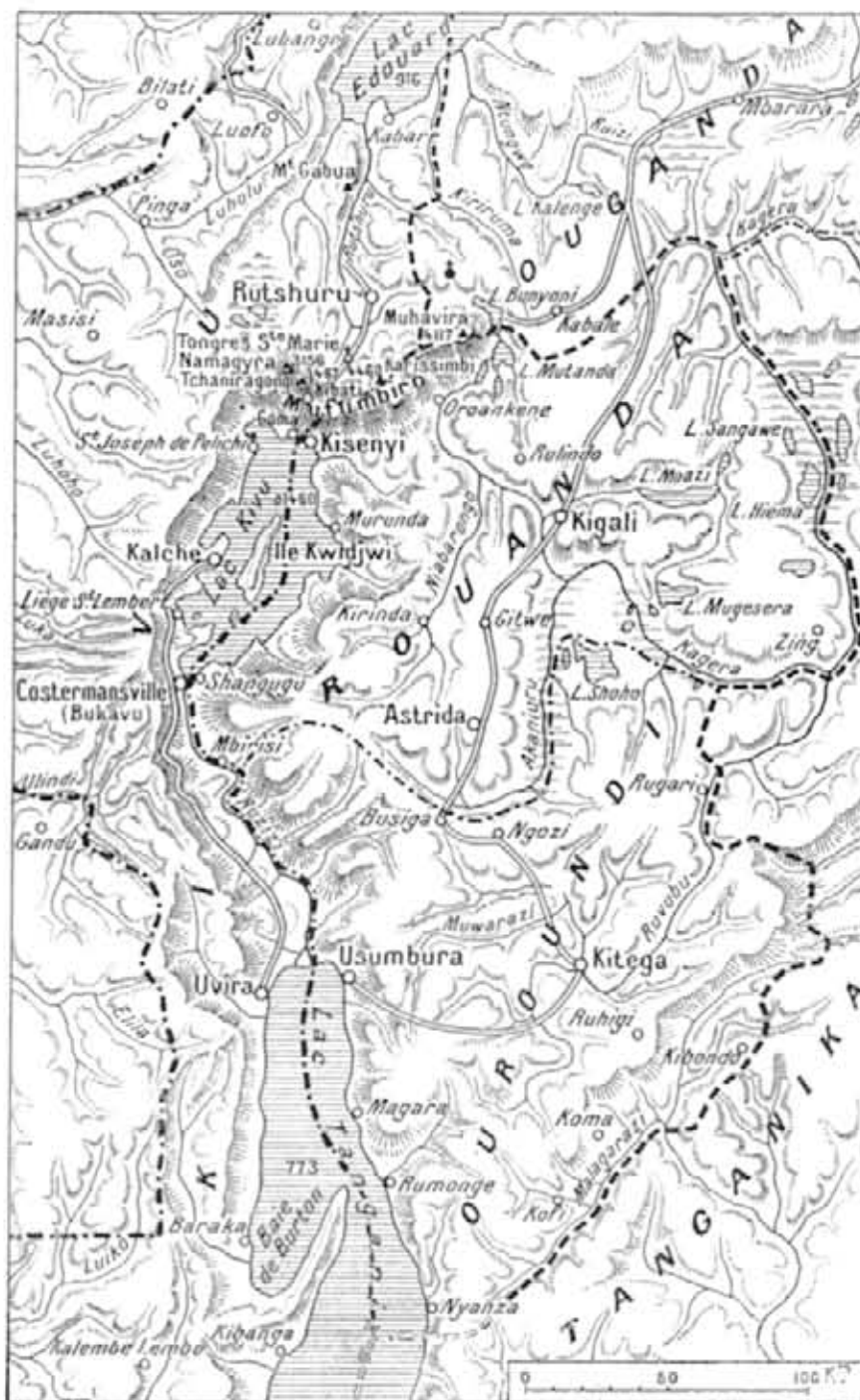
Les environs du lac Kivu.

La ville nouvelle de Costermansville (Bukavu), chef-lieu du district, s'élève sur une étroite presqu'île où l'on a séparé, sans souci des distances, les divers quartiers : le quartier administratif avec de jolies villas dans la « botte », le quartier du négoce dans l'isthme et le quartier du Comité