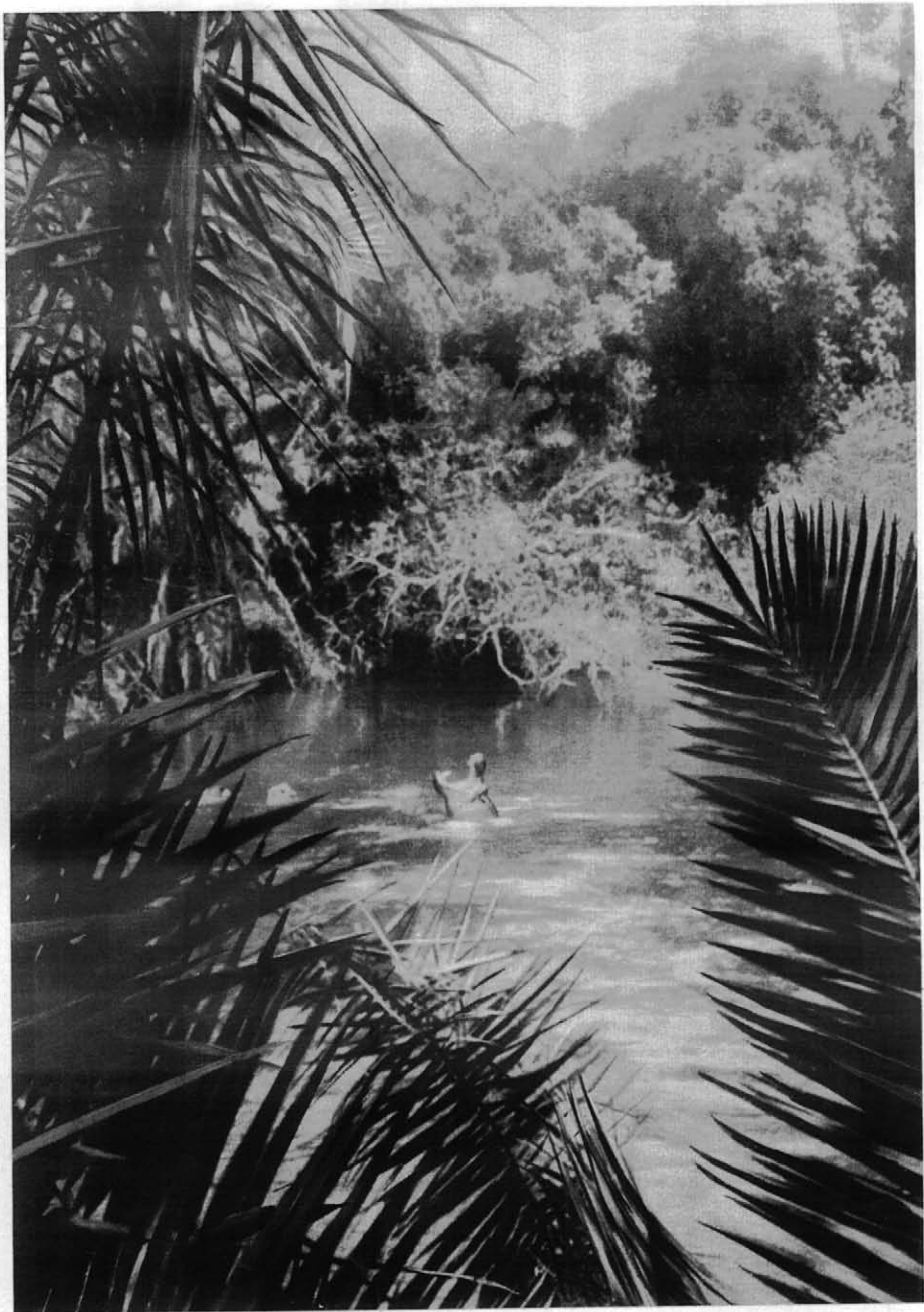
ÉBATS D'HIPPOTAMES DANS LA RUTSHURU AUX CONFINS DU CONGO BELGE