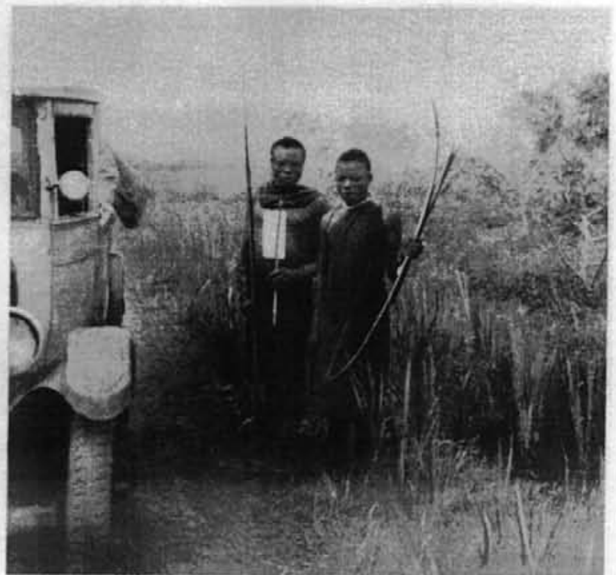
Rencontre de messageurs portant un pli, sur la piste de Rutshuru à Irumu.