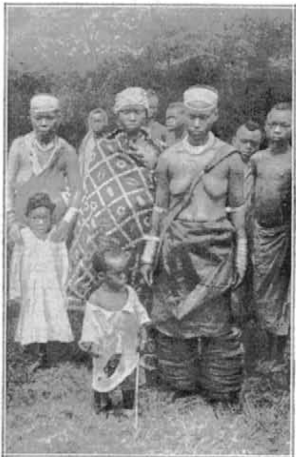
Trois des femmes de Mwa Kayembe, sultan de Kibati.

du bassin du Nil dont Ptolémée plaçait les sources au delà de deux grands lacs et qu'il supposait alimentées par les neiges des montagnes de la Lune, de quelques degrés seulement trop au sud. Les cartes publiées au quinzième siècle d'après ses descriptions représentent bien son cours dans une Afrique dont la moitié sud est sacrifiée, tandis qu'à partir du dix-septième siècle les côtes bien tracées enserrant une hydrographie fantaisiste faisant sortir le Nil et le Congo d'un lac immense et fabuleux. Il faut arriver au dix-neuvième siècle pour que Stanley découvre le lac Edouard en 1889, que