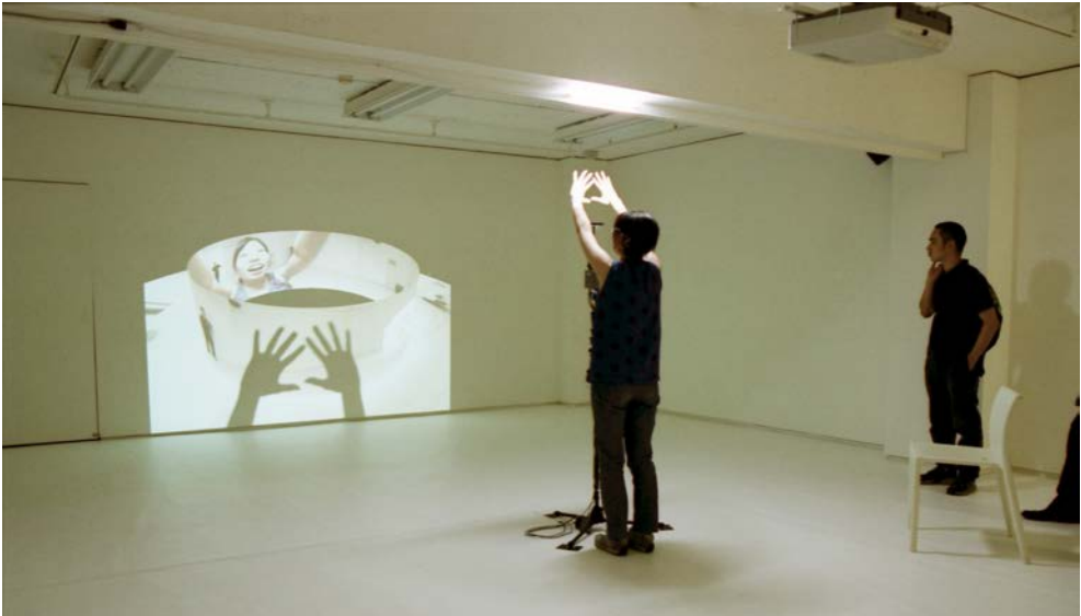
Figure 4. Masaki Fujihata, Morel's Panorama (2003), ordinateur, caméra panoramique, projecteur, pour l'exposition « L'Invention de Morel ou la fabrique des images », Maison de l'Amérique latine (2018), Commissariat T. Dufrene.

qui pourrait prendre le contrôle des humains, type HAL9000 de 2001, Odyssée de l'espace (1968). Dans Morel's Panorama (2003), l'artiste japonais Masaki Fujihata propose de la même manière au visiteur d'introduire une variabilité infinie par sa présence (voire son jeu) dans le dispositif ouvert d'enregistrement/projection (voir la Figure 4). Le passage de l'approximatif (si l'on reprend le titre du recueil de poèmes publié par Tzara en 1931 : l'homme moderne comme approximation calculée) au variable (Philip K. Dick) constitue l'apport du numérique à la création de « mondes virtuels ». Prenons l'œuvre en VR d'Anne-Laure Cazin, Freud, la dernière hypnose (2019). Le spectateur peut changer de point de vue : soit il est le patient, soit il est Freud ; aujourd'hui, l'artiste travaille à un cinéma neuro-émotif où le spectateur doté d'un double équipement (casque de VR et casque à électrodes pour EEG) peut modifier l'ambiance du film projeté (musique, couleurs) et infléchir le déroulement du film selon ses réactions émotives – des mesures d'ondes cérébrales sont faites régulièrement, qui commandent la bifurcation du contenu narratif (soit il s'agit d'une résultante, l'ambiance d'une salle dans laquelle trois ou quatre personnes sont équipées, soit il s'agit d'une expérience individuelle). On peut imaginer à terme une sensibilité particulière de pilotage du dispositif par le cerveau sensible.