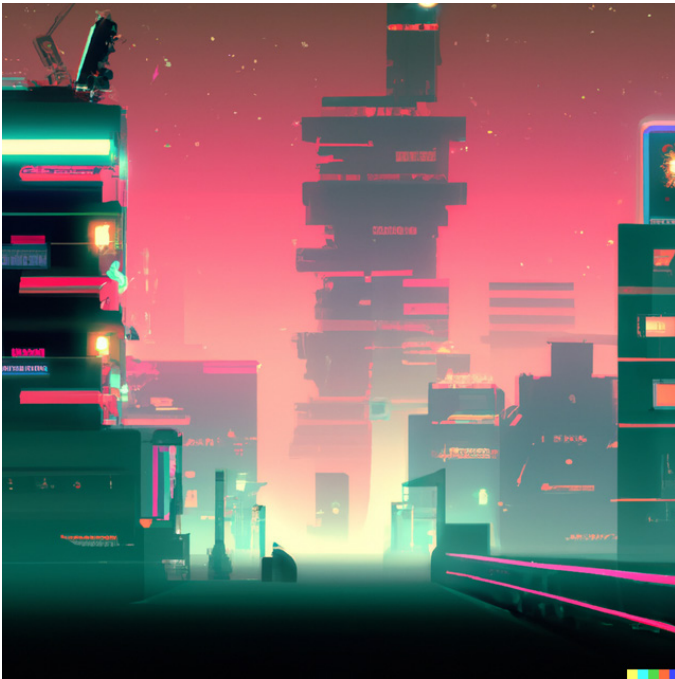
Figure 3. Denis Villeneuve, Blade Runner 2049 (2017)

2049, 2017, voir la Figure 3), Dick imagine un monde post-apocalyptique où chacun chez soi communique avec tous les autres éparpillés dans l'univers au moyen d'une « boîte à empathie » : on y voit à l'écran un homme de dos qui monte péniblement la pente raide d'un chemin caillouteux, après quelques secondes on est soi-même cet homme appelé Mercer et on ressent tout ce qu'il ressent en même temps que tous les autres connectés à la « boîte à empathie » – un peu comme l'image du Léviathan de Hobbes où la multitude compose la figure immense du monarque. Mercer est lapidé et chacun en ressent la douleur sur son propre corps. Il s'agit d'une figure christique. S'échappant de la réalité, l'usager de la boîte expérimente une vision transformatrice qui est, au minimum, un exercice d'apprentissage, et, au plus haut niveau, un « exercice spirituel » au sens d'Ignace de Loyola, le fondateur de l'ordre des Jésuites, qui recommandait aux professes de se figurer mentalement – jusque dans le moindre détail – la Passion du Christ : les images des églises jésuites et baroques y aidaient les profanes. Selon Dick, c'est par l'entraînement de l'empathie que les humains se distinguent des robots. Ce que diffuse la boîte à empathie est à l'opposé de la télévision de divertissement diffusée en continu par l'ami Buster.