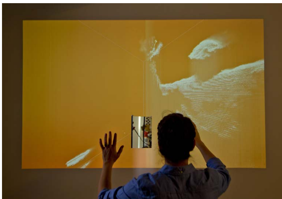
Figure 2. Rafael Lozano-Hemmer, First Surface (2012), ordinateur, Kinect 360, projecteur, miroir, image 175 x 122 cm, pour l'exposition « L'Invention de Morel ou la fabrique des images », Maison de l'Amérique latine (2018), Commissariat T. Dufrené (Copyright : Rafael Lozano-Hemmer).

projetées, et à devenir lui-même un « intrus » dans le monde des images : il aura pris soin de donner l'image d'une proximité amoureuse avec Faustine. Il change donc les disques, non sans avoir compris que les machines tuaient : une fois enregistré, l'être dépérit et seule son image (avatar ?) vit. Il sait qu'en s'enregistrant, il mourra, mais il préfère cela à ne pas s'inscrire dans le temps éternel de l'image, le monde de l'idée de l'amour de Faustine. Mais pour quel spectateur ? Dans les derniers feuillets où il décrit sa déchéance physique, il espère un inventeur, le troisième après Morel (anagramme de « le mort ») et lui-même (le naufragé) : l'homme d'une alliance nouvelle après un nouveau Déluge (une guerre mondiale, une dictature politique universelle – il fuit la police de son pays –, une catastrophe écologique ?) : un inventeur qui saurait permettre aux images (avatars) de pénétrer dans la conscience les unes des autres – c'est-à-dire d'obtenir une transparence totale : alors seulement, il pourra – écrit Bioy – entrer « dans le ciel de la conscience de Faustine » ; formulation eschatologique d'un paradis possible de la virtualité, transparence totale désirable ou prison numérique, paroxysme du panoptique de Bentham.