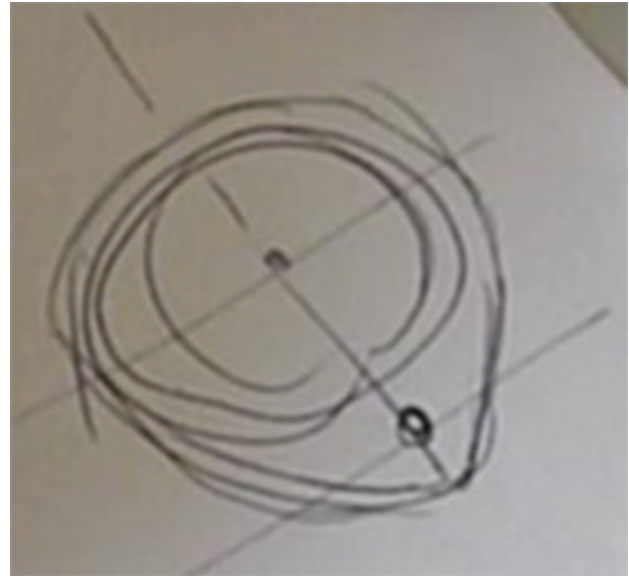
Figure 2 : Croquis en coupe du tube en forme de goutte d'eau permettant le passage du mécanisme.

La forme des brins est non plus cylindrique, mais en « goutte d'eau » (voir la Figure 2 ci-dessous), ce qui permet d'isoler le système et de protéger la tige qui actionne le mécanisme, tout en renforçant la rigidité du bâton.