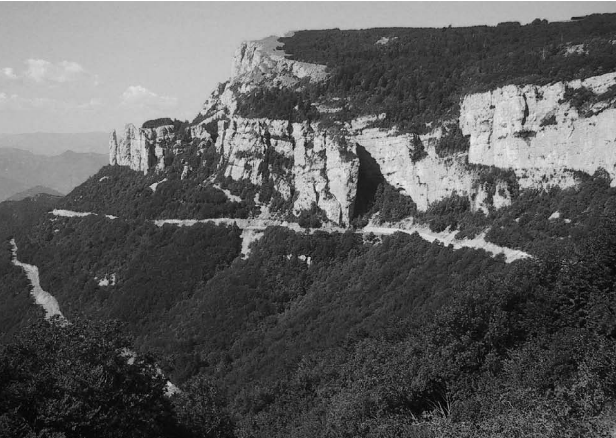
Figure 1. Les gigantesques falaises du Vercors sont constituées de calcaire. Cette roche est un produit de la vie puisqu'elle résulte de l'accumulation de restes d'organismes nanoscopiques. Leur taille est certes infime, mais leur nombre est immense. (Falaises du Vercors, vues vers le Sud-ouest à partir du col du Rousset).

trement dans un catalogue, au niveau international. Le nombre total d'espèces vivantes répertoriées se situe un peu au-dessus de 1,7 million. Il subsiste néanmoins une incertitude, car il se peut que certaines espèces aient été décrites de manière distincte par des auteurs différents et fassent, de ce fait, l'objet de plusieurs enregistrements.