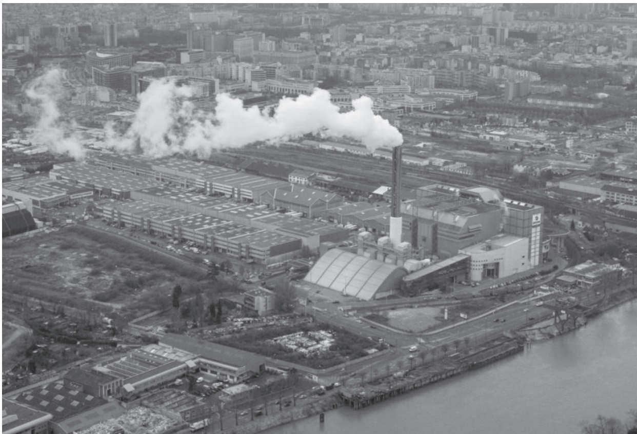
Photo 1 : L'incinération des bouteilles plastiques émet-elle vraiment plus de chlore que le recyclage ? (Usine de traitement des ordures ménagères Syctom-CPCU de Saint-Ouen, Seine-Saint-Denis).

considérés comme se substituant à 100 % de résines vierges (par exemple, pour la fabrication de tubes de drainage bi-peau, pour le PVC).