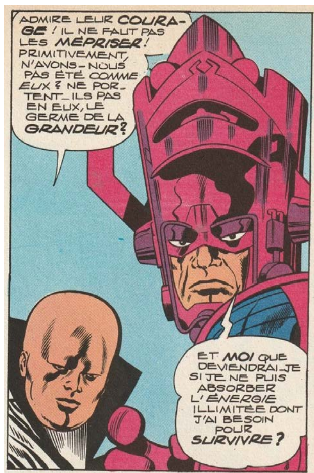
Figure 1 : Galactus et Le Gardien dans La Saga du Surfer d'argent , bande dessinée du scénariste Stan Lee et du dessinateur Jack Kirby, 1965.

Je citerai un seul exemple, pour son originalité, mais aussi pour son caractère symbolique. Il s'agit de La Saga du Surfer d'argent , bande dessinée du scénariste Stan Lee et du dessinateur Jack Kirby publiée en 1965 3 . Le Surfer est le héraut de Galactus, entité redoutable qui, pour satisfaire sa consommation démesurée d'énergie, vide les planètes de leurs éléments vitaux et les laisse stériles. À la recherche de nourriture pour son maître, le Surfer jette son dévolu sur la Terre, où il y affronte les Quatre Fantastiques 4 , une équipe de super-héros dont le courage l'impressionne. Il décide alors de s'allier à eux et, avec l'appui du Gardien 5 , ils réussissent à mettre Galactus en échec. Ce dernier épargne la Terre, mais y exile le Surfer, en lui retirant les pouvoirs qui lui permettaient de parcourir l'univers à la vitesse de la lumière.