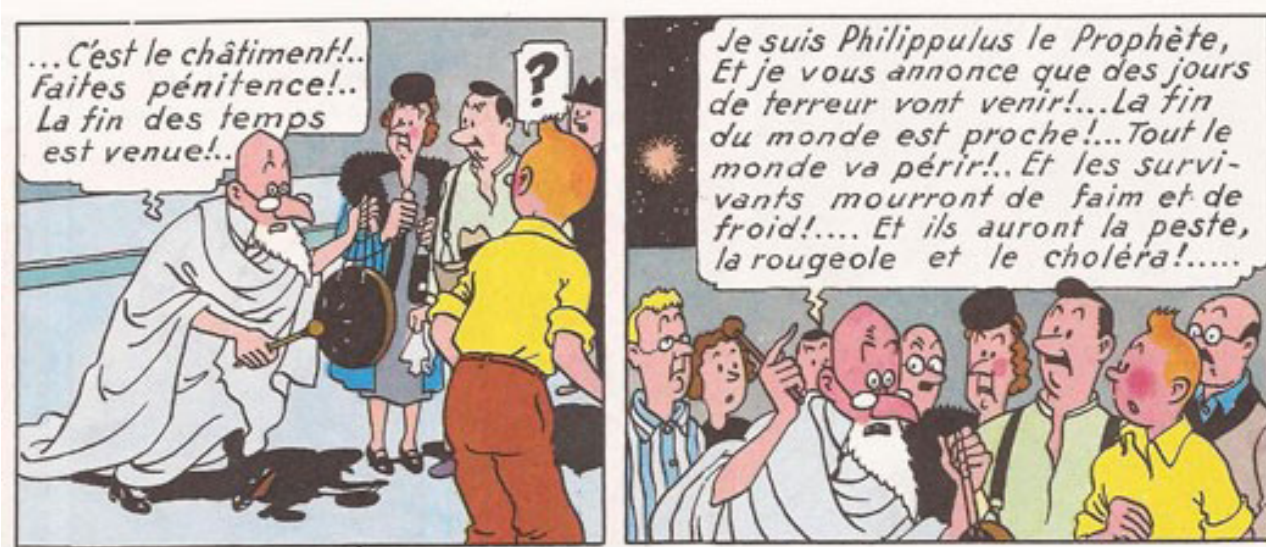
Figure 2 : Philippulus le prophète, Hergé, L'Étoile mystérieuse , 1942 – © Hergé-Moulinsart 2022.