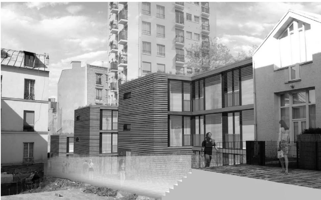
Projet de rénovation urbaine s'intégrant dans le Plan Climat de Paris (passage de la Duée, quartier de Ménilmontant, Paris XX e ) (photo-montage Atelier Pascal Gontier-Paris).

rôle de sensibilisation important auprès d'un très large public, tout en permettant à de nombreux projets de s'afficher comme « environnementaux », malgré des performances plutôt modestes.