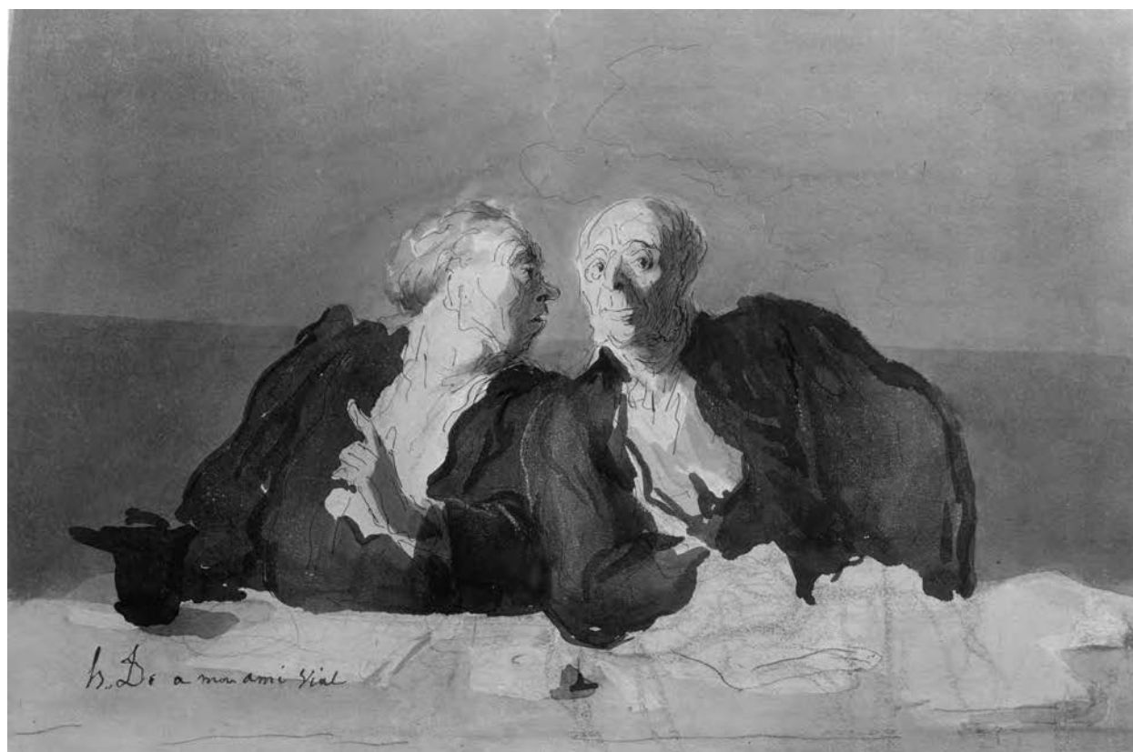
« Chacune des parties prenantes apprend de sa mise en relation avec une autre entité ». “Un argument péremptoire” , aquarelle de Daumier (1808-1879), 1850.

Sans envisager la concurrence entre les différentes parties prenantes, la diversité des objets d'apprentissage (ce qui est appris et les caractéristiques de ce qui est appris) inscrit l'apprentissage dans un processus. À ce stade, nous pouvons préciser notre question de recherche, qui devient : « La consultation des PPL n'est-elle qu'un exercice de style ou bien doit-elle être envisagée comme le point d'ancrage d'un processus