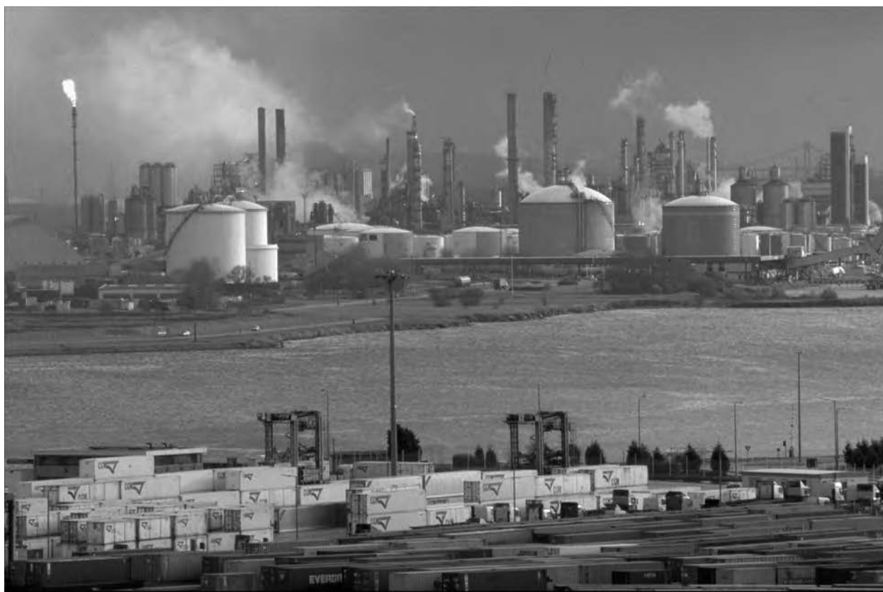
« Total a scindé les attentes devant faire l'objet d'une réponse de la part du site de celles relevant de l'ensemble de la zone industrielle du Havre ». Vue de la raffinerie de Normandie située dans la zone industrielle du port du Havre (en avril 1998).

mieux communiquer auprès de ses PPL, mais aussi impliquer les salariés du site dans une démarche sociétale. Lors de nos derniers entretiens, notre recherche a permis de faire prendre conscience aux responsables de la communication de la place privilégiée occupée par les salariés dans le RDD local. Il est d'ailleurs intéressant de noter que ce RDD local n'est disponible en version électronique que sur l'intranet de la raffinerie de Normandie, ce qui renforce une fois de plus la place occupée par les salariés dans le processus.