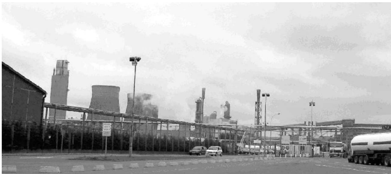
La plate-forme chimique de Mazingarbe couvre une superficie de 180 ha environ et regroupe un peu plus de 300 employés ; elle est caractérisée par un environnement proche très urbanisé et particulièrement dense.

La plate-forme chimique de Mazingarbe compte deux établissements dits AS. Ces établissements relèvent de la société de la Grande Paroisse et de la Société Artésienne de Vinyle (SAV). La société Grande Paroisse exploite un site de production d'acide nitrique et d'engrais à base d'ammonitrates comprenant notamment des installations de dépotage d'ammoniac (citerne ferroviaire en train de 1 000 t d'am-