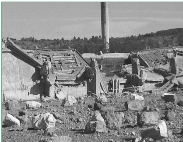
Figure 2. Projections de blocs de béton des murs du bâtiment 221 à 120 m du cratère et dégâts au bâtiment de stockage voisin.

Douze heures après l'explosion, 300 véhicules et 900 pompiers étaient à pied d'œuvre. L'Inesc [6] (Institut natio-