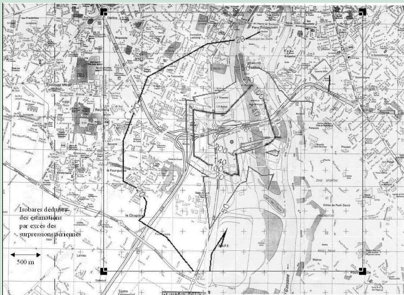
Figure 6. Représentation des surpressions aériennes estimées par excès (moyenne de 40 T).

L'histoire particulière de la ville de Toulouse et de ses usines à risques, montre que la zone urbaine s'est progres-