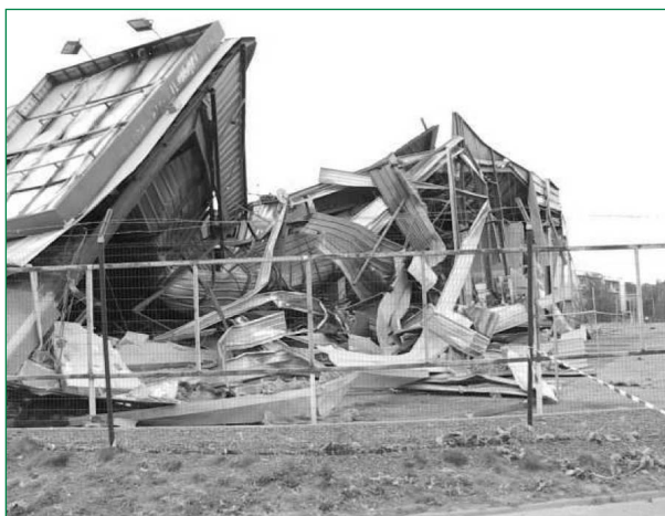
Figure 3. Vue d'un magasin de grande distribution situé à 320 m du cratère.