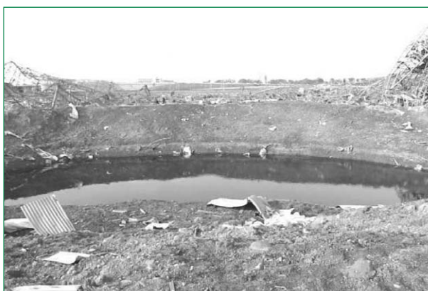
Figure 4. Une vue du cratère.

nal d'études pour la sécurité civile) souligne, dans son retour d'expérience, que les premiers sauveteurs se sont engagés sans avoir pris connaissance des risques qu'ils encourent (les premières mesures du risque toxique n'étant disponibles que trois quarts d'heure après l'explosion).