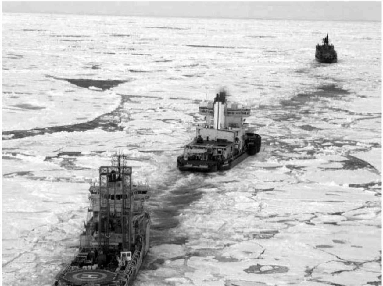
Forage scientifique réalisé à proximité du pôle Nord lors de la campagne IODP de 2004. Le navire de forage est accompagné de deux brise-glaces.

L'éloignement des secteurs de production des hydrocarbures des centres de consommation rend nécessaire la réalisation de pipelines sur des distances considérables, avec une technologie très spécifique et très coûteuse. Leur réalisation nécessite des investissements colossaux et fait appel à des montages financiers parfois surprenants. Ainsi, le gazoduc qui devrait acheminer le gaz de la péninsule de Yamal vers le sud sera construit grâce à une association des russes Novatek et Gazprom avec QPI-Qatar Petroleum International [18]. La construction du TAPS ( TransAlaska Pipeline Systems ) qui transporte le pétrole sur plus de 1 000 km des zones de production de Prudhoe bay au Nord de l'Alaska vers le terminal pétrolier de Valdez, au Sud, avait nécessité un investissement de 8 milliards de dollars à la fin des années 1970. Sa capacité de transport, après avoir culminé à 2,1 millions de barils par jour en