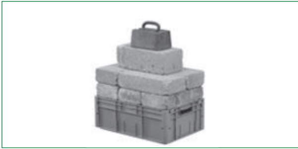
Figure 2 : Exemple de produit labellisé : un polypropylène servant à la fabrication de caisses résistant à des charges mécaniques assez importantes destinées au stockage et au transport de marchandises.

Ici, l'unité fonctionnelle est une caisse pouvant transporter et stocker une charge de 20 kg. Sa durée de vie est de dix ans. Les autres spécifications techniques de l'unité fonctionnelle sont elles aussi définies [3].