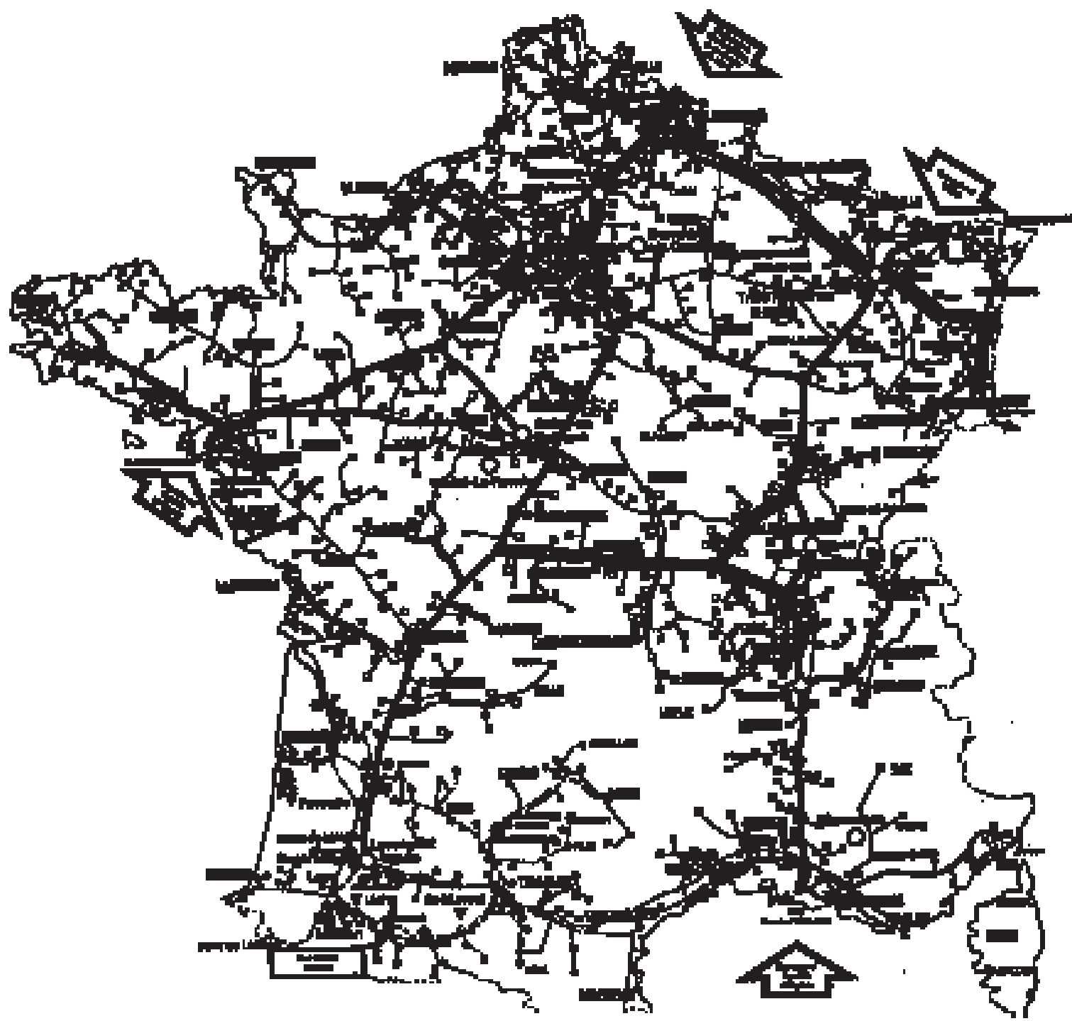
INDUSTRIE GAZIÈRE - Production et transport du gaz au 1 er janvier 1997