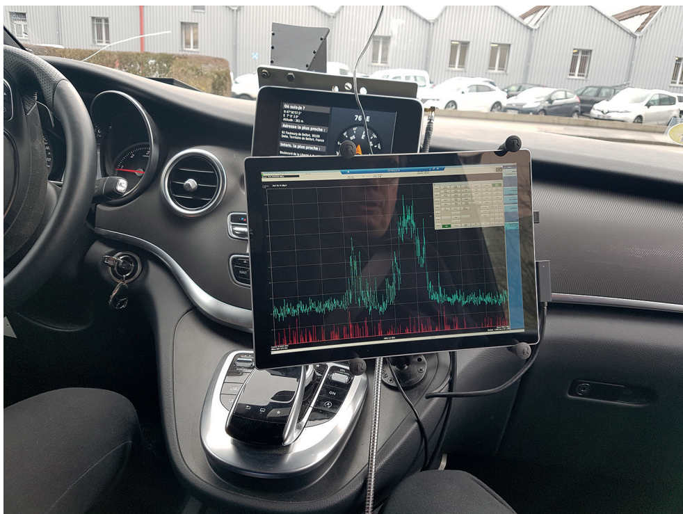
Recherche de la cause d'un brouillage de radar météo.

L'attribution et la protection des fréquences pour l'observation de la Terre dans le cadre de l'UIT bénéficient de certains atouts mais ont aussi des faiblesses inquiétantes. Un atout important est le fait que le spatial et la météorologie sont fortement organisés à l'échelle mondiale. On peut ainsi noter que l'UIT et l'OMM sont toutes les deux installées à Genève à quelques centaines de mètres l'une de l'autre, et ont l'habitude de travailler ensemble comme le montre la réalisation en commun d'un manuel sur l'utilisation du spectre radioélectrique pour la météorologie (OMM-UIT, 2017). Un autre atout a été que les besoins en fréquence ont été exprimés depuis longtemps et satisfaits à une époque où la concurrence pour ces fréquences était beaucoup moins exacerbée qu'aujourd'hui.