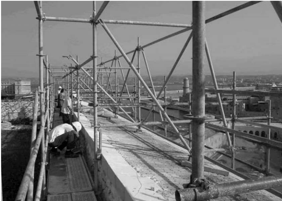
Photo 2 : Chantier de réhabilitation du Fort Saint-Nicolas, à Marseille.