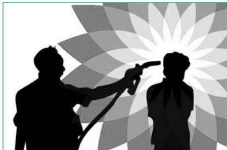
Photo 1 : Parodie du nouveau logo de la compagnie pétrolière BP.

Le 20 avril 2010, une explosion et un incendie se déclarent sur une plateforme offshore de BP, Deepwater Horizon. Sur les cent quinze personnes qui en constituent l'équipage, onze décèdent, et dix-sept sont blessées. La perte de la pla-