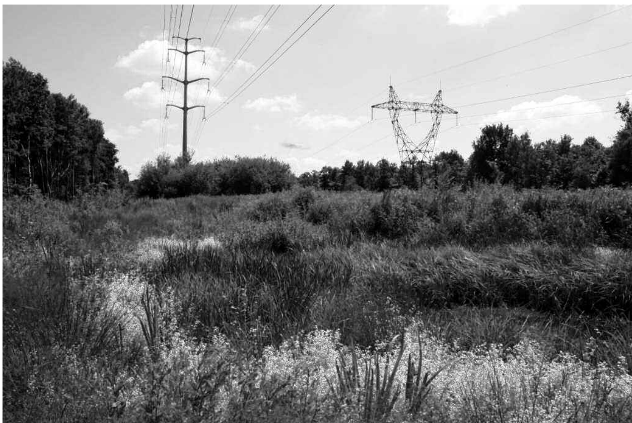
Forêt de Notre Dame.

La cohabitation des différents réseaux de transport est une réalité historique. Les civilisations qui se sont succédées au long des siècles ont construit des réseaux qui ont été amenés à se croiser : ainsi, les aqueducs témoignent encore du franchissement de certaines voies romaines par des adductions d'eau. Puis le réseau des canaux s'est ajouté au réseau routier, lui-même suivi par le réseau des voies ferrées au XIX e siècle et, enfin, par celui des autoroutes, des gazoducs et des lignes électriques et de télécommunication, au XX e . Les ingénieurs ont su trouver les solutions pour que ces réseaux se croisent tout en maintenant la fonctionnalité de chacun d'entre eux. Aujourd'hui, un nouveau réseau doit être construit, la Trame verte et bleue (TVB). Pour y parvenir, naturalistes, ingénieurs, aménageurs et législateurs doivent ensemble innover, trouver des solutions à des problèmes parfois complexes qui nécessiteront encore des études et de l'expérimentation. Sans attendre la résolution de tous les problèmes, la nouvelle toile doit commencer à se tisser.