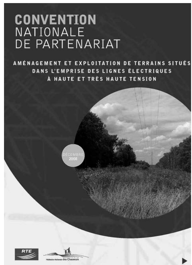
Convention Nationale de Partenariat – RTE.

Ce principe de contractualisation tripartite a maintenant été étendu à tous les projets biodiversité quel que soit le gestionnaire du territoire concerné. RTE ne souhaite pas être