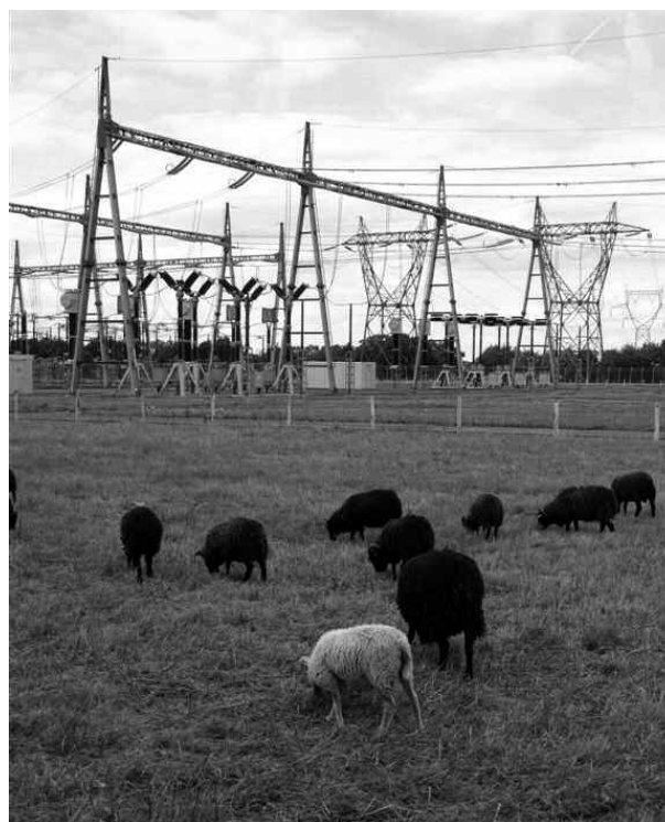
Entretien du poste électrique de Louisfert, en Loire Atlantique, par des moutons d'Ouessant.

à atteindre, s'y ajoute la nécessité de clôturer le terrain et parfois de le dessoucher et d'y semer une prairie permettant d'amorcer le processus. Une des difficultés est de trouver l'éleveur, en particulier dans certaines régions où l'élevage a quasiment disparu.