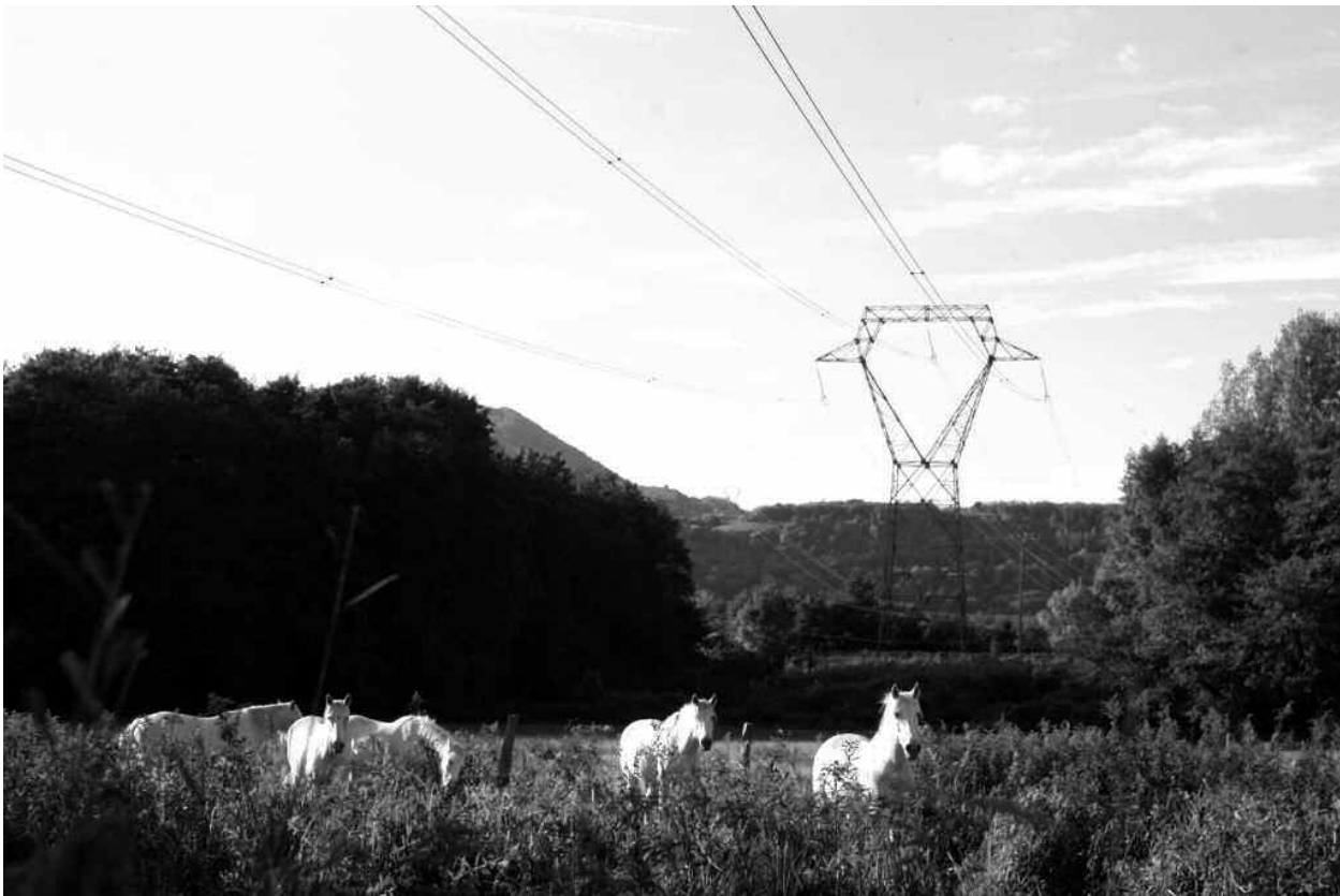
Chevaux camarguais sous une ligne électrique, dans l'Isère.

Une alternative est de confier l'entretien de l'espace au porteur du projet biodiversité, qui, de ce fait, apportera toute son attention aux objectifs du projet. C'est le principe même du partenariat conclu avec la Fédération Nationale des Chasseurs : RTE aide financièrement les chasseurs à aménager l'emprise sous les lignes qui, en contrepartie, assurent l'entretien de l'espace. Celui-ci est réalisé de façon à favoriser le gibier, ce qui profite à l'ensemble de la faune sauvage.