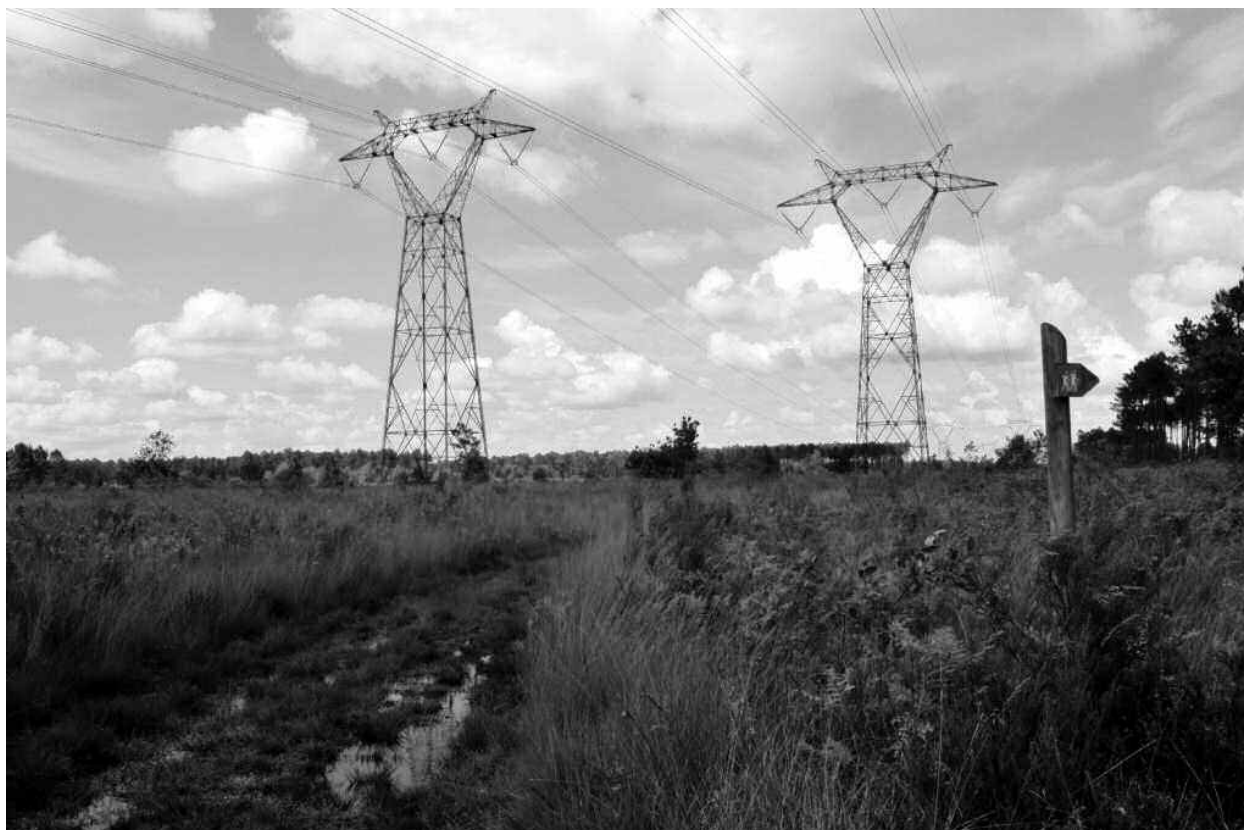
Stations de gentianes du genre Pneumonanthe dans un couloir de lignes électriques.

Le cas le plus symbolique est sans doute celui du petit papillon l'Azuré des mouillères ( Maculinea alcon ), dans les landes de la Gascogne. L'Azuré des mouillères est menacé de disparition. Sa reproduction est dépendante d'une plante hôte, la gentiane pneumonanthe, sur laquelle il pond ses œufs, et d'une fourmi qui récupère les larves tombées au sol