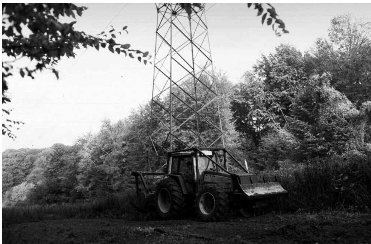
Entretien d'une tranchée forestière avec un gyrobroyeur.