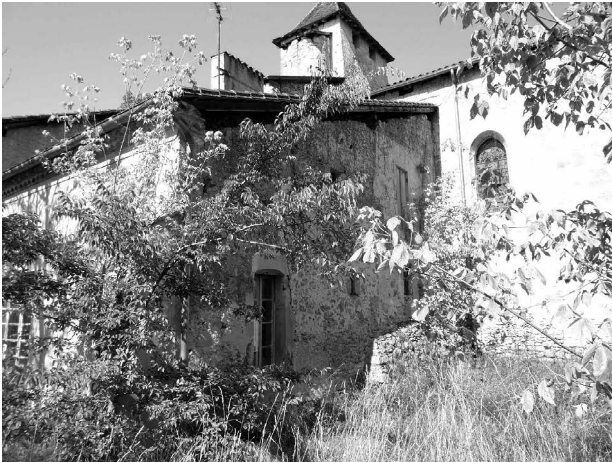
Ancien presbytère de Saint-Justin.