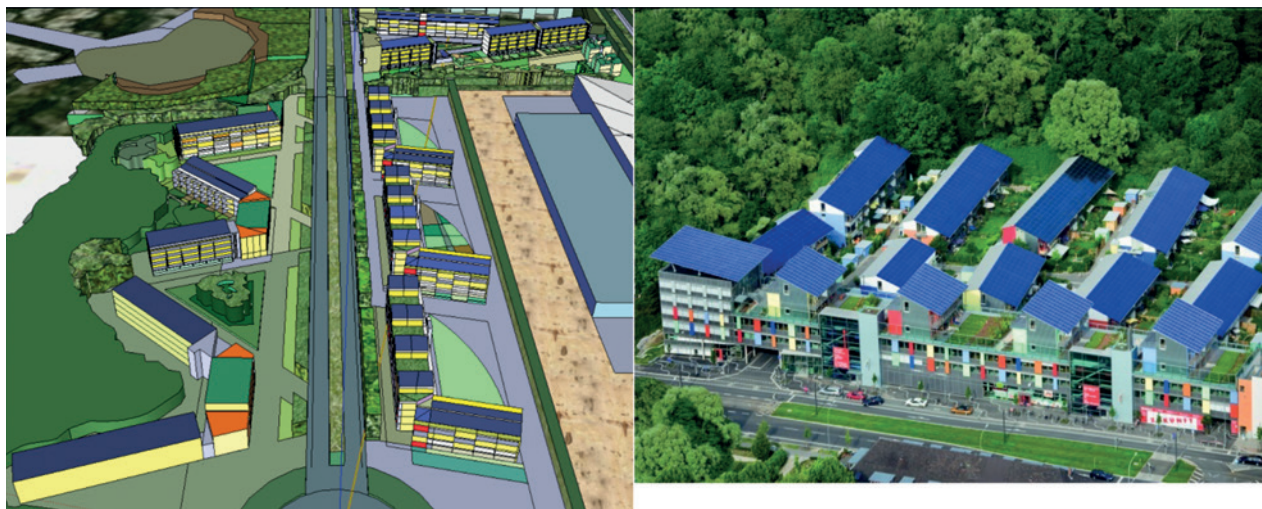
Figure 1 : à gauche, projet d'aménagement étudié (ACT Consultants) et, à droite, vue du quartier à énergie positive de référence.

Pour mieux cerner leur fiabilité, huit outils européens ont été comparés dans le cadre du réseau thématique européen PRESCO. Dans l'exemple d'une maison suisse à ossature bois, la contribution à l'effet de serre calculée sur 80 ans diffère de +/- 10 % selon les outils. Ces travaux européens se poursuivent, l'un des axes de travail étant la simplification des analyses et la validation des hypothèses simplificatrices. Certains paramètres ne sont pas connus avec précision : c'est le cas par exemple de la durée de vie des bâtiments. Des analyses de sensibilité permettent alors de vérifier la robustesse des résultats en faisant varier ces paramètres incertains.