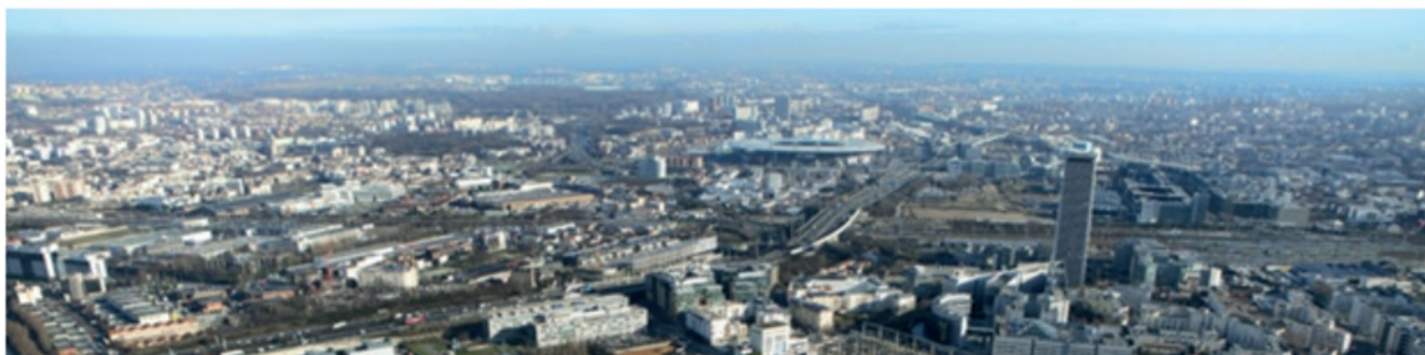
Vue générale de Plaine Commune (Seine-Saint-Denis) (à droite, la Tour Pleyel et, au centre, le stade de France).

Pour une durée de cinq ans, « Rêve de scènes urbaines » bénéficiera du soutien de l'État, à la suite de l'appel à projets « Démonstrateurs industriels pour la ville durable », dont il a été lauréat en mars 2016. L'État accompagnera la démarche pour faciliter l'innovation, notamment sur les aspects méthodologiques et les questions réglementaires en matière d'urbanisme et d'environnement.