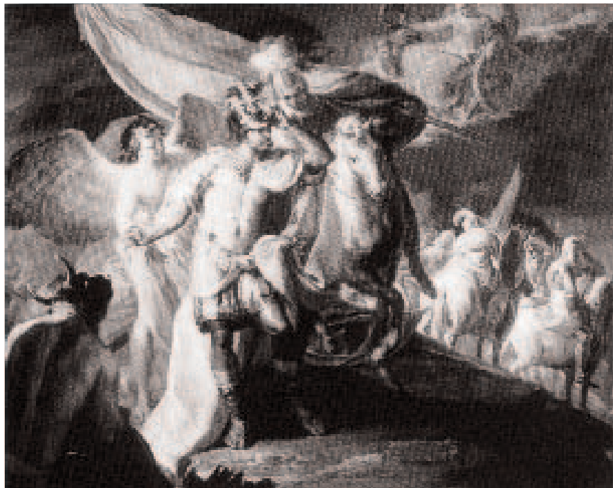
Cudillero Fundación Selgas-Fagalde

(Francisco Goya, Hannibal vainqueur découvrant pour la première fois l'Italie depuis les Alpes, 1771)