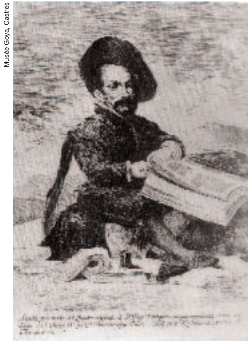
Musée Goya, Castres

Le directeur de thèse a encore du mal à faire explorer au thésard la littérature académique, car elle paraît à ce dernier fade par rapport aux aventures qu'il vit. Il lit bien sûr les textes directement utiles : s'il est impliqué dans une gestion de projet par exemple, il lit ce qui fait autorité sur le sujet. Il arrive à prendre intérêt à des ouvrages qui proposent des grilles de lecture générales donnant sens aux péripéties qu'il vit, ou à des textes rapportant des observations avec lesquelles il voit des rapprochements. Mais cela reste souvent vague