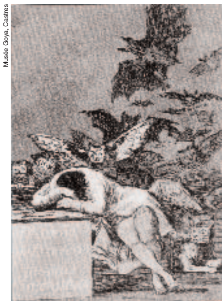
Musée Goya, Castres

Cette phase donne lieu à de nombreux échanges entre le thésard et le directeur de thèse, et c'est souvent celle où leur relation est la plus critique. Le directeur doit, en effet, empêcher le thésard de fuir vers les idées faciles, les concepts à la mode, sans le décourager pour autant. Il doit reconnaître l'émergence d'une idée féconde, souvent exprimée de manière confuse, et encourager le thésard à l'approfondir. Si le thésard ne trouve pas de fil, je lui suggère de prendre ses colères et ses enthousiasmes comme repères. D'une part, sublimer une colère ou faire partager un émerveillement sont deux puissantes sources de motivation, et l'on fait rarement une œuvre forte sans passion. D'autre part, les faits qui choquent ou étonnent sont ceux auxquels ni l'air du temps ni les lectures n'avaient préparé ; ils peuvent donc être des pistes d'idées nouvelles.