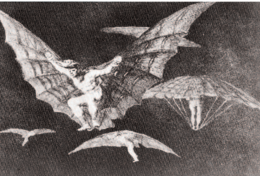
Musée Goya, Castres

Lorsqu'on arrive sur un terrain, c'est comme en parachute quand on a peu d'expérience : on contrôle mal l'endroit où l'on atterrit. (Francisco Goya, Les proverbes, Manera de volar ?, planche n° 13)