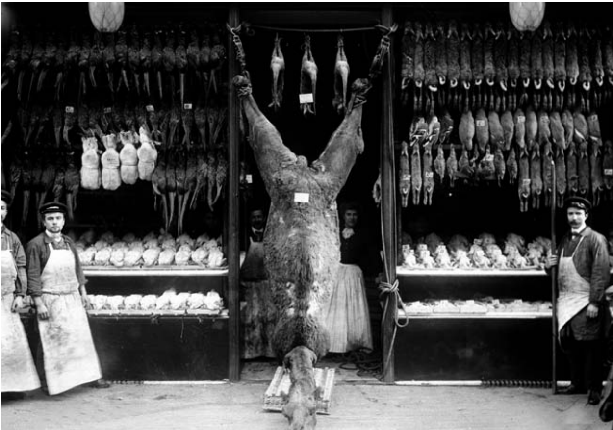
L'espace utilisé comme lieu de l'expérimentation est le rayon ( chameau exposé à la devanture d'un marchand de gibier et de volaille, Paris, 1908 ).

stand vers la chambre froide à partir de 21 h 20 et à commencer le nettoyage des machines dix minutes plus tard. Ainsi, les clients ne sont pas toujours servis après 21 h 30 (alors que l'hypermarché ferme à 22 heures), notamment dans l'hypothèse où la demande nécessite l'utilisation d'une machine de découpe : il faut en effet à nouveau la nettoyer, après utilisation. Des clients s'en sont déjà plaints, par l'intermédiaire de la boîte à idées. Là encore, le chef de rayon confirme l'existence de ce problème, considérant que les vendeuses commencent trop tôt le rangement et le nettoyage afin d'« en finir le plus vite possible ». « Belle mentalité! », ajoute-t-il en précisant qu'il ne peut pas résoudre ce problème : « Moi, je quitte le magasin à 20 heures, alors... »;