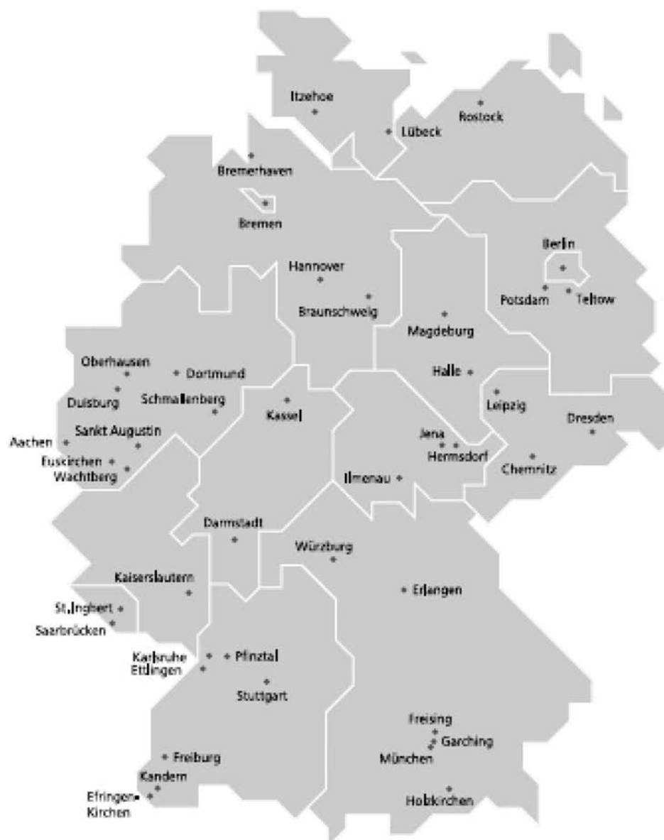
Figure 1 : Localisation géographique des différents instituts fraunhofer.

structurée en différents « groupes de compétences » et « alliances » qui réunissent l'expertise de différents instituts autour d'une thématique. Dans le cadre de programmes internes, ces groupes travaillent sur des sujets communs financés par des fonds mis à leur disposition par le siège.