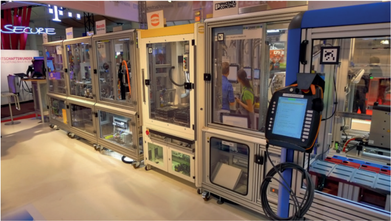
Le démonstrateur Smart Factory KL à la Foire de Hanovre en 2015.

treprises, décloisonne les savoir-faire et amène à révisiter les conditions de propriété industrielle. Le démonstrateur illustre la capacité à créer un leadership collectif en s'appuyant sur les métiers des différentes parties prenantes.